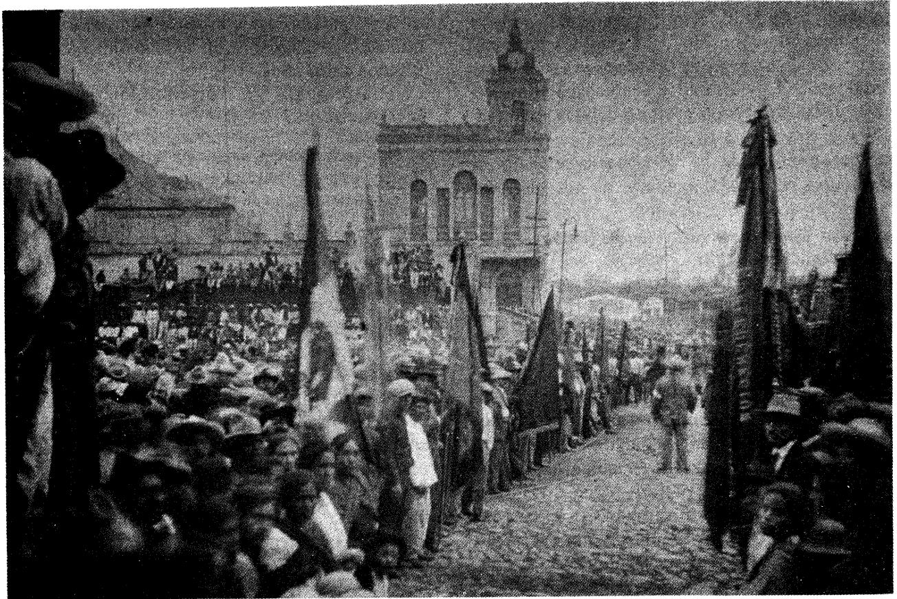
Los cromistas expresan su descontento, pero siempre conservando su identidad nacional. (Archivo Sindical textil de Santa Rosa).

El segundo punto de la orden del día respondía al problema de la relación entre los trabajadores y los partidos. Los considerandos establecían que para hacer la revolución se necesitaba la “perfecta organización” de la clase obrera en agrupaciones sindicales, que los partidos políticos “no han sido hasta la fecha sino organizaciones creadas para lograr el escalamiento del poder, los traidores a la causa del proletariado”, que el “partido comunista mundial luchaba por el comunismo usando como medio la dictadura transitoria del proletariado”, misma que se justificaba si no era “ejercida por un partido que se abrogue la repre-