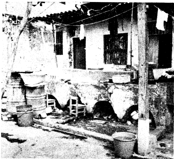
Viviendas y lavaderos de los estibadores veracruzanos. (Del libro Obreros somos... ).

El tipo de trabajo desempeñado también muestra diferencias entre mujeres de la tercera generación y sus madres y abuelas. La transformación durante la industrialización en el porfiriato condujo a cambios en el mercado de trabajo. En algunas áreas la industria textil empleó abundante mano de obra femenina. Curiosamente no fue así en Río Blanco, donde las textileras fueron pocas, concentradas todas en un departamento de la fábrica. Pero las migrantes llegaron con la costumbre de trabajar e ingresaron, sobretodo, al comercio y los servicios. 13 Eran fonderas,