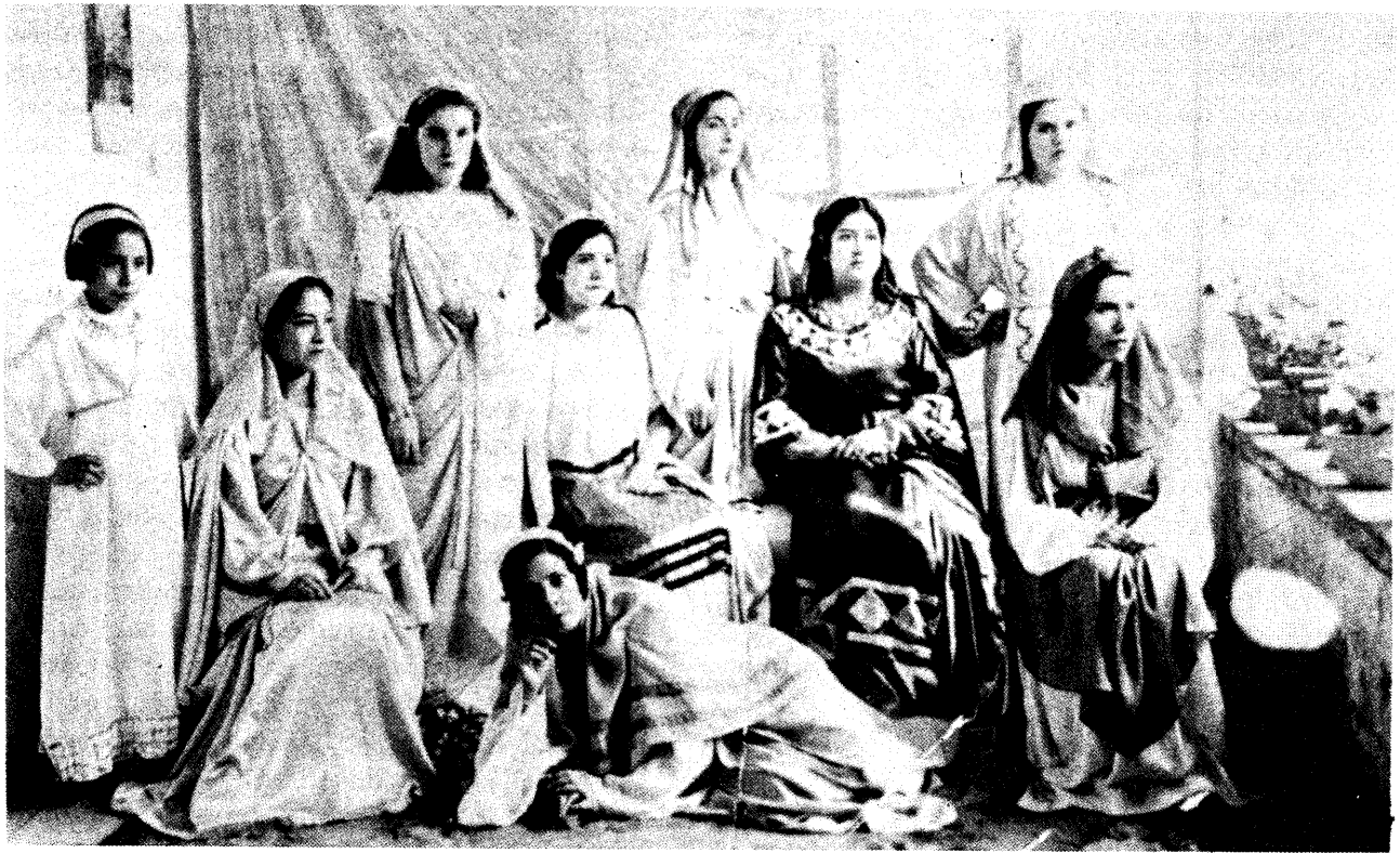
Hijas de mineros representan una obra de teatro en Angangueo. (Del libro Obreros somos... ).

El siglo presente podríamos dividirlo en dos periodos. El primero parte del auge industrial del porfiriato y nos lleva hasta los años de la institucionalización revolucionaria (de 1890 a los años treinta). El segundo comienza con un nuevo auge industrial en la década de los cuarenta y termina con la presente crisis económica. 21 Estos periodos incluyen importantes sucesos de orden político y económico, que no hace falta detallar aquí. Baste decir que la sociedad mexicana de 1950 es otra de la de 1900. Coinciden estos cortes con la periodización sugerida para el trabajo