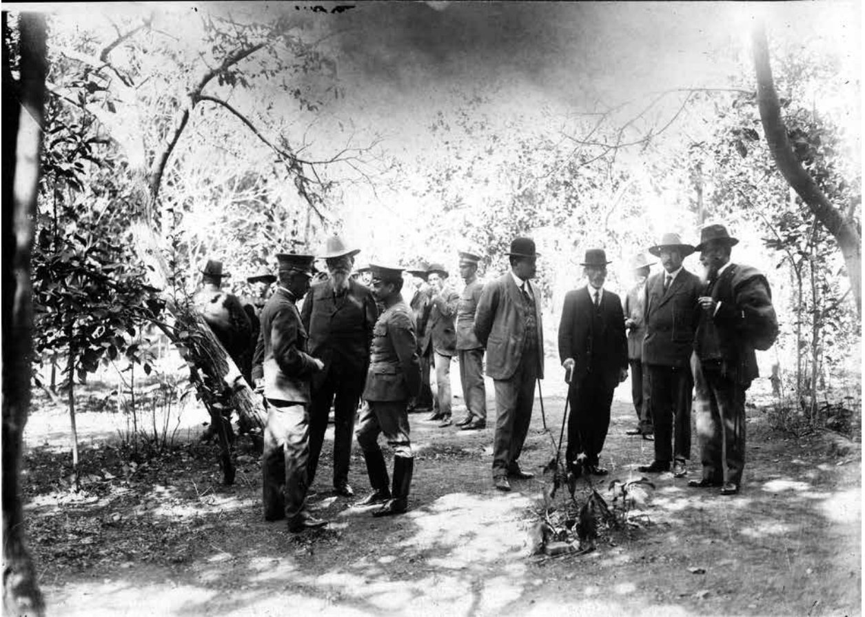
El Primer Jefe con algunos diputados en La Cañada. Historia Gráfica del Gobierno Constituyente, celebrado en Querétaro de Arteaga, del 20 de noviembre de 1916 al mes de febrero de 1917.