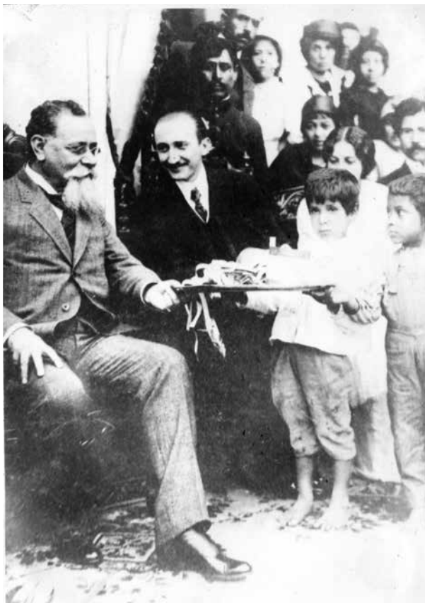
Foto 5. Reparto de premios a los alumnos del kínder. Sep. 1914. Referencia: Fondo Carranza, serie fotográfica de la Revolución constitucionalista, tomo II, foja 6v, 1963-1965. Fotografía plata gelatina.

en cuestión muestra a Carranza y a Palavicini sentados; frente a ellos dos niños de pie, con sus ropas sucias y desgastadas, descalzos, recibiendo los presentes, y detrás de ellos un guardián del orden. Esta imagen le sirvió al Doctor Atl como modelo para pintar el cuadro que lleva por título “Venustiano Carranza y Palavicini”, donde interpreta los elementos principales, presentándolos de una manera más amable: los niños llevan sus mismas ropas, pero menos miserables, y se omite la presencia del oficial (foto 6).