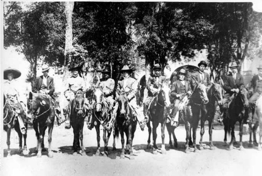
Foto 7. Periodistas y fotógrafos que acompañaron al Primer Jefe a su salida de la ciudad de México. Oct. 1914. Referencia: Fondo Venustiano Carranza, serie fotográfica de la Revolución constitucionalista, tomo II, mayo 1917-1920, p. 22, 1963-1965. Fotografía plata gelatina.