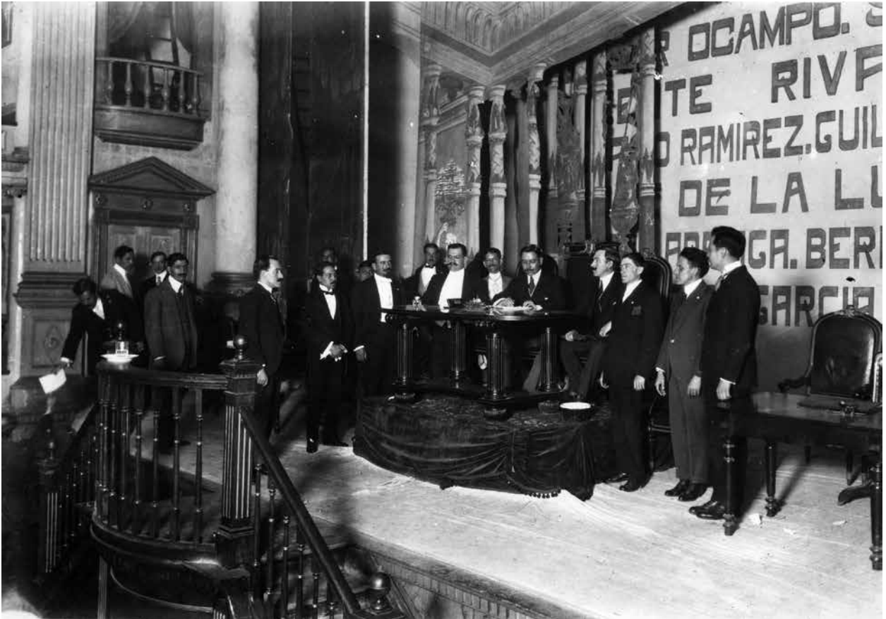
El Primer Vicepresidente, general Cándido Aguilar, firma la nueva Constitución. Historia Gráfica del Gobierno Constituyente, celebrado en Querétaro de Arteaga, del 20 de noviembre de 1916 al mes de febrero de 1917.