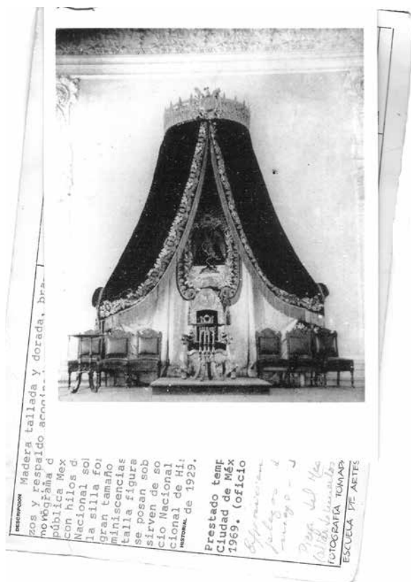
Foto 4. Silla, laterales, frontal y capitel de Benito Juárez. Referencia: Ficha de la Curaduría de Mobiliario y Enseres Domésticos. Imagen fotográfica tomada de El Mundo Ilustrado , Escuela de Artes y Oficios, 3 de agosto de 1913. Fotografía plata gelatina.

una fila de chalchihuites, seguida de una hilera central con 20 glifos, entre ellos el ollin , el jaguar, la flor, la lagartija y la serpiente; rematan la pieza los rayos del sol. 17 Esta descripción recuerda una de las prácticas de transición del poder: